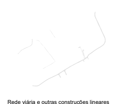
Rede viária e outras construções lineares